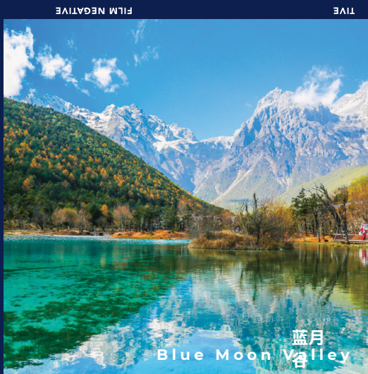
蓝月谷 Blue Moon Valley