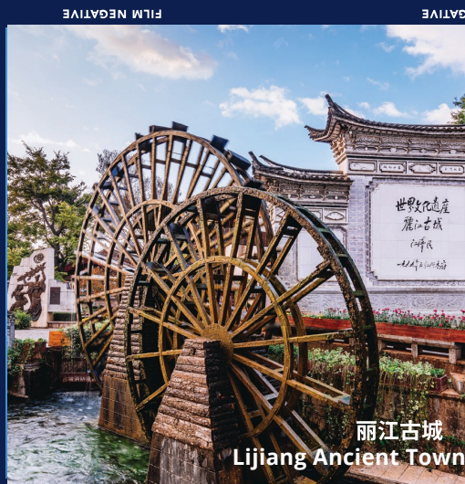
丽江古城 Lijiang Ancient Town