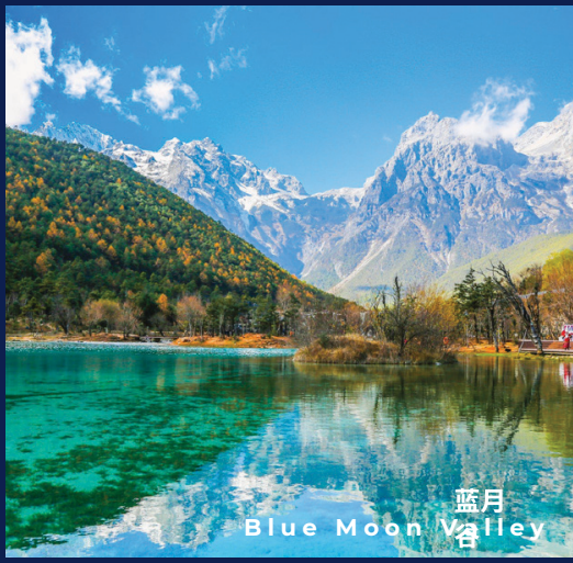
蓝月 Blue Moon Valley