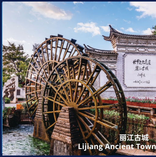
丽江古城 Lijiang Ancient Town