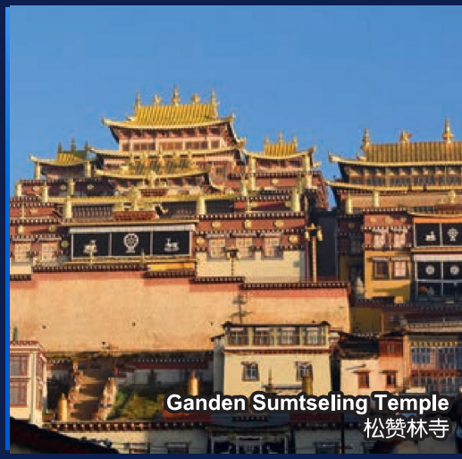
Ganden Sumtseling Temple 松赞林寺